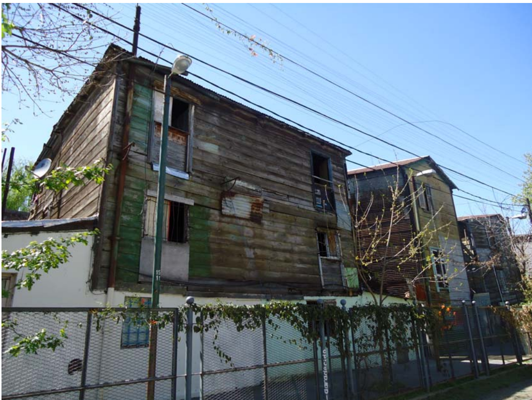
LA BOCA – CASAS SOBRE LA TRAZA DEL TREN