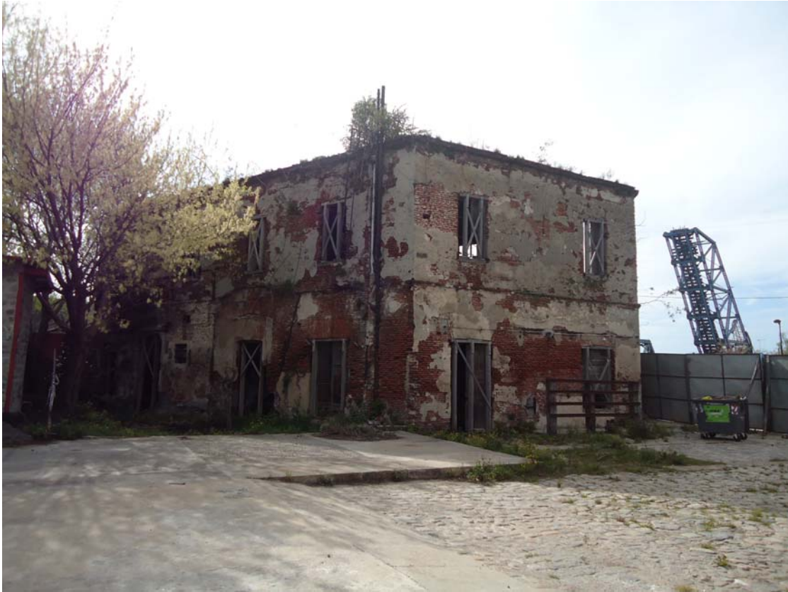
BARRACA PEÑA – PATIO INTERIOR