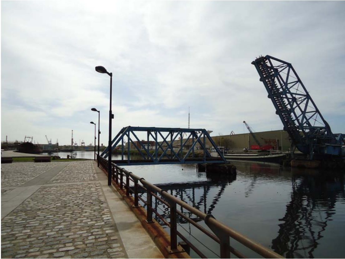
RIACHUELO – PASEO PEATONAL Y PUENTE MOVIL.