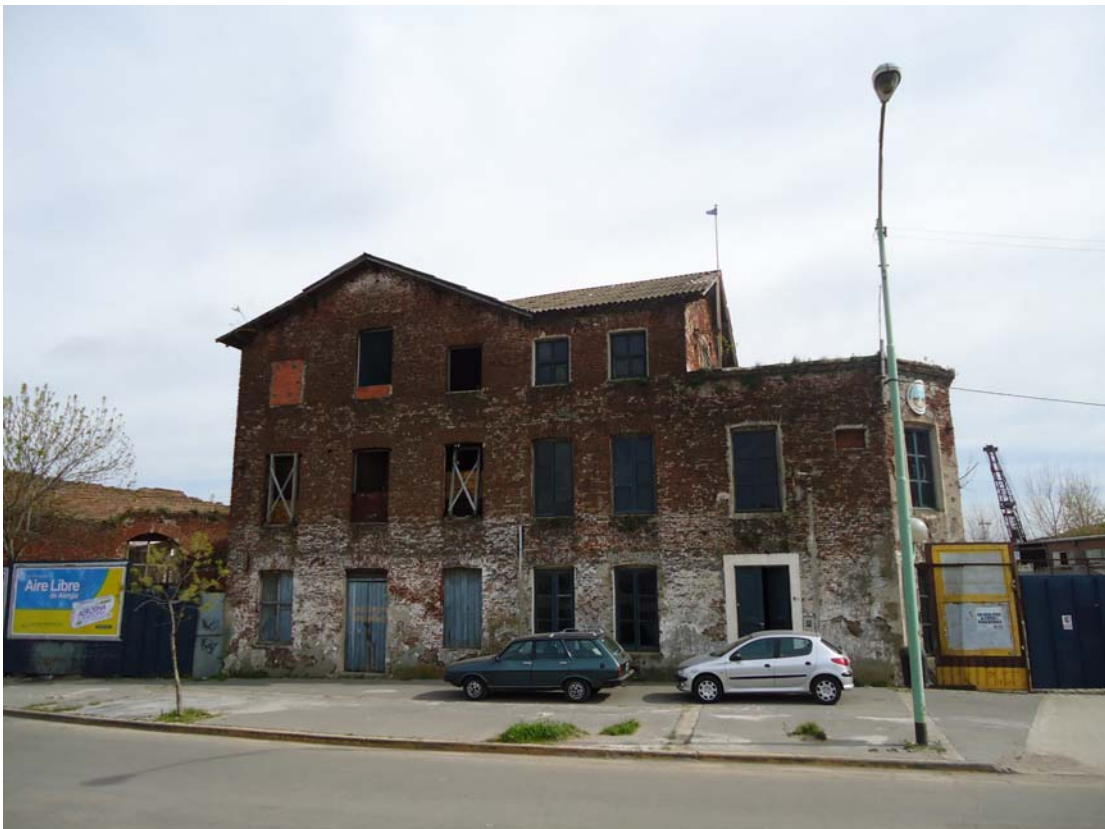
BARRACA PEÑA – VISTA EXTERIOR